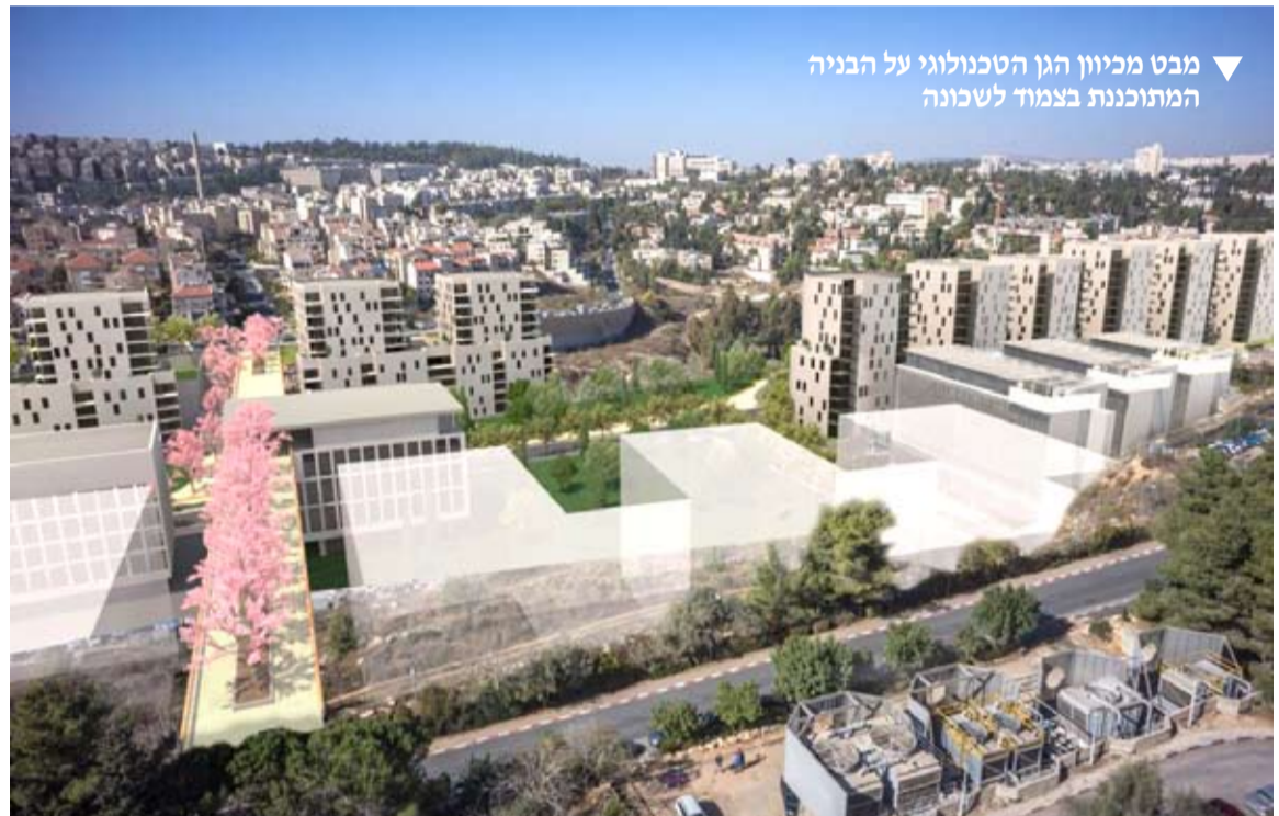
מבט מכיוון הגן הטכנולוגי על הבניה המתוכננת בצמוד לשכונה

דני טאבור - יו"ר הוועדה לתכנון פיזי במינהל הקהילתי גלי טייג - ברין - עובדת קהילתית אדרי' אריאלה קורנפלד - מתכנתת שכונתית